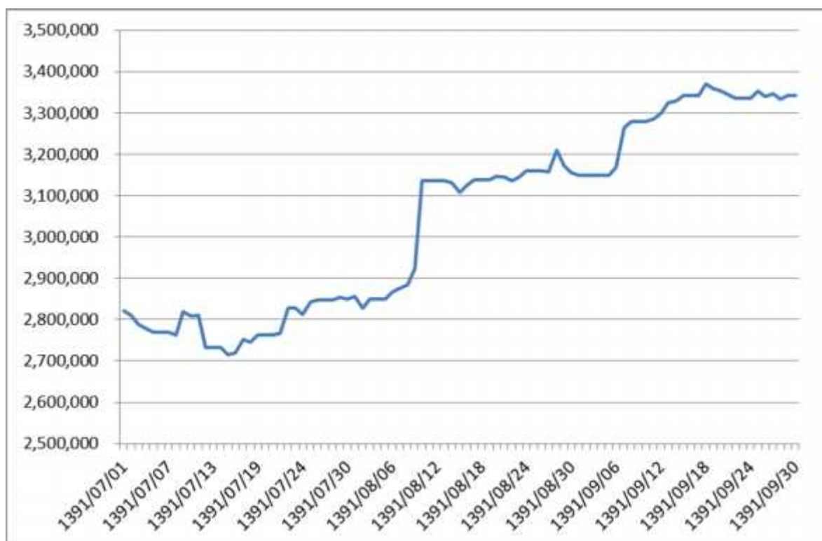
نمودار تغییرات تعداد واحدهای سرمایه گذاری صندوق