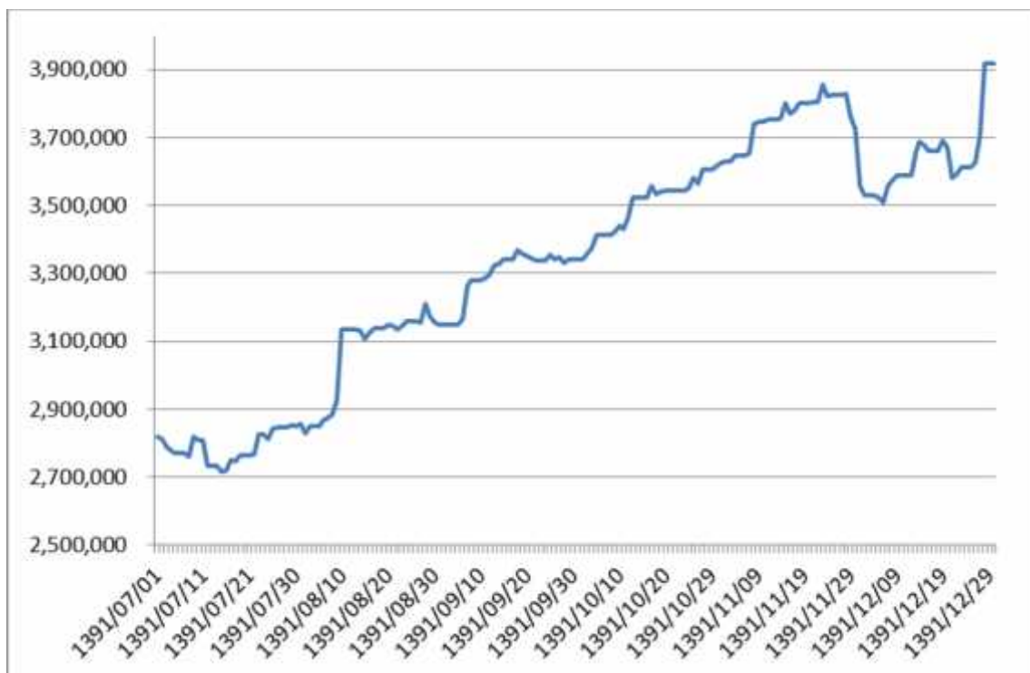
نمودار تغییرات تعداد واحدهای سرمایه گذاری صندوق